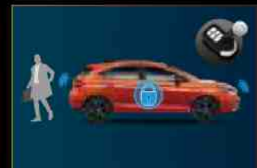
New Walk-Away Auto Lock