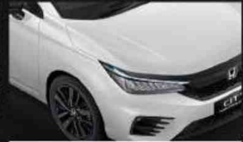
Platinum White Pearl