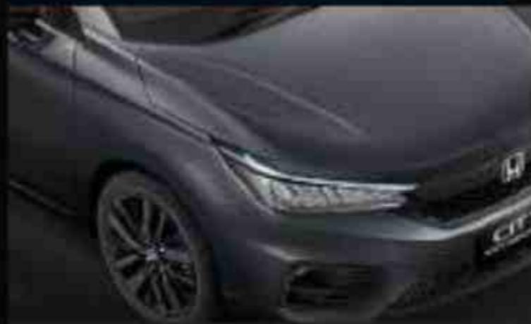
Meteoroid Gray Metallic