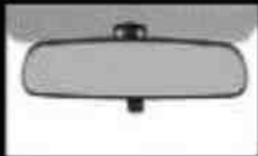
Day/Night Rear View Mirror