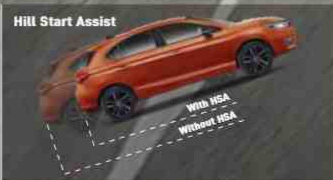
Hill Start Assist