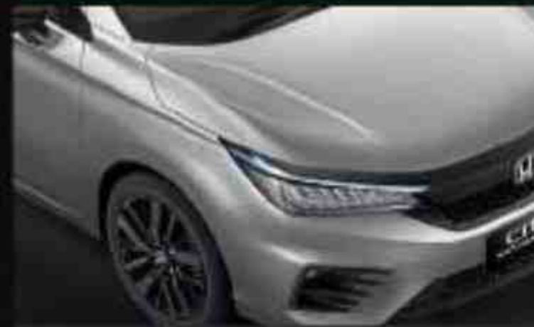
Lunar Silver Metallic