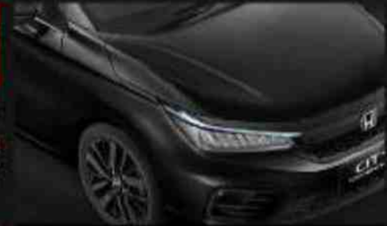
Crystal Black Pearl