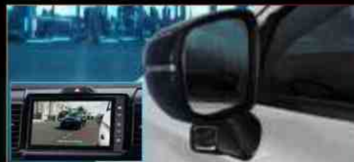
New Honda LaneWatch™