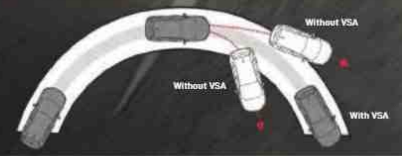
Without VSA Without VSA With VSA