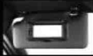
Sun Visor with Vanity Mirror