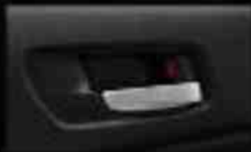
Auto Door Lock by Speed