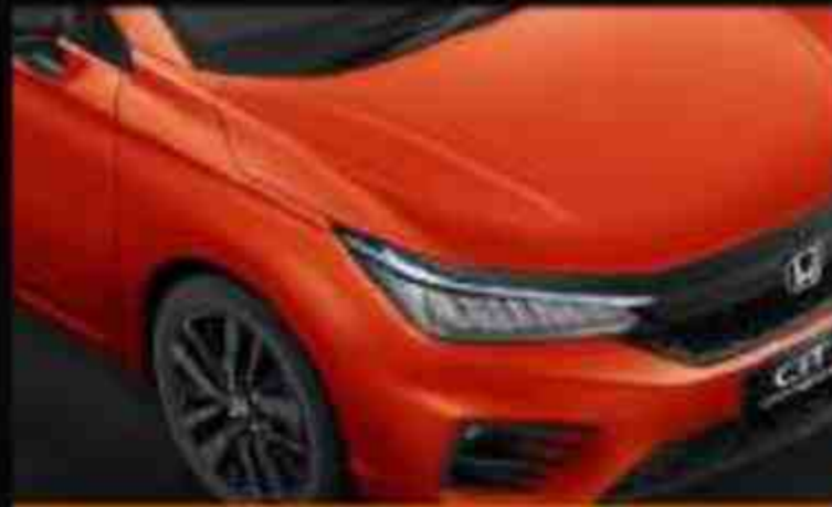
Phoenix Orange Pearl

Honda City Hatchback RS tampil dengan enam pilihan warna berbeda yang mencerminkan karakter Anda yang dinamis.