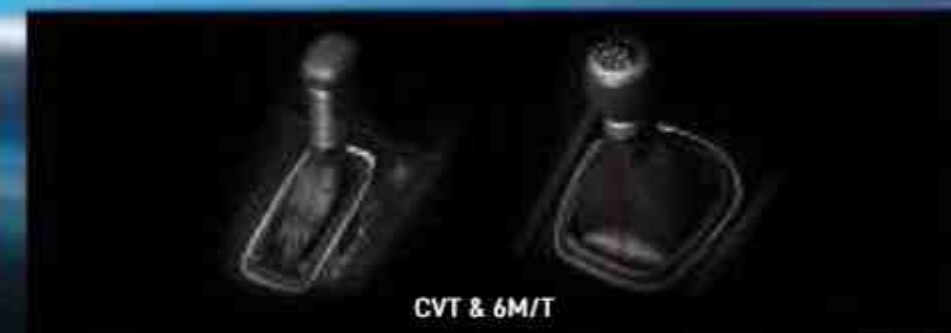
CVT & 6M/T