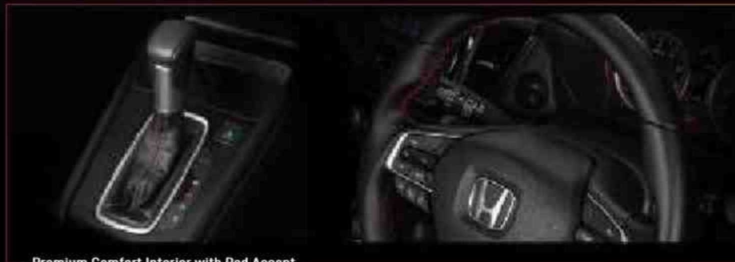
Premium Comfort Interior with Red Accent

Kabin yang luas berlapis material berkualitas untuk menghadirkan kenyamanan yang berkelas, semakin memantapkan Anda untuk terus melangkah ke depan.