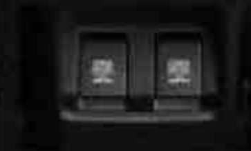
2 nd Row Power Outlet