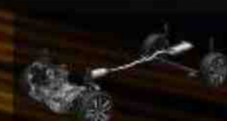
MacPherson Strut & H-Shape Torsion Beam Suspension