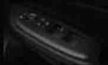
Door Switch Panel