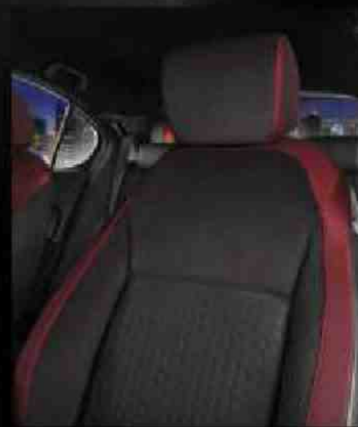
Suede-Fabric-Leather Combi Trimmed Seats