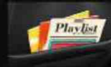
Seat Back Pocket