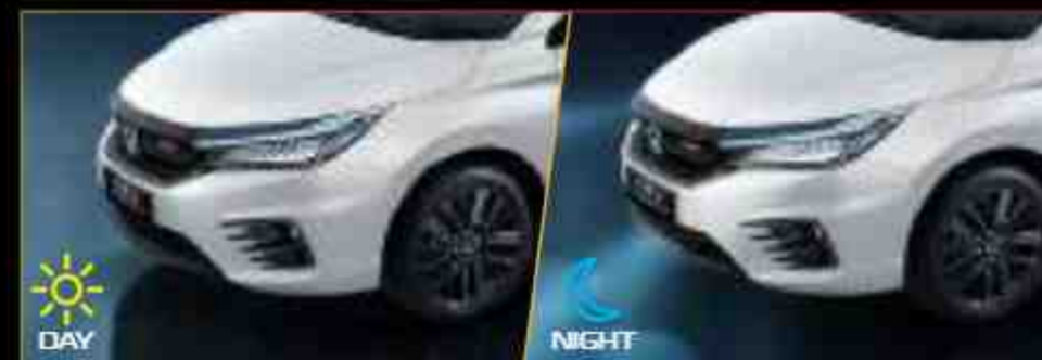
New Auto Headlights