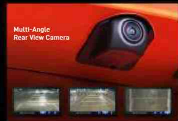
Multi-Angle Rear View Camera