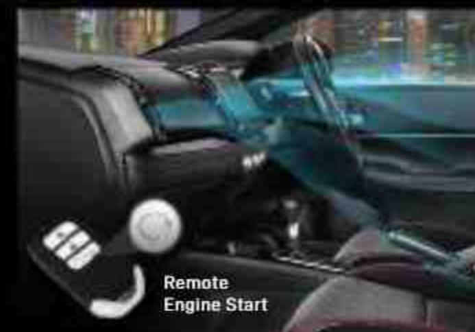
Remote Engine Start

Dilengkapi dengan fitur berteknologi tinggi yang siap mendukung hasrat Anda dan memudahkan semua aktivitas selama berkendara.