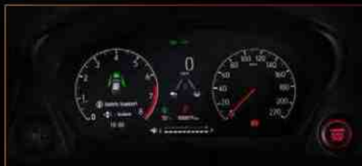
New 7" Interactive TFT Meter Cluster

Saat Anda berkendara diatas kecepatan 40km/jam dengan posisi tuas lampu diputar dari low beam ke posisi AUTO, sistem ini secara intuitif akan berganti antara lampu besar dan lampu normal tergantung pada situasi jalan.