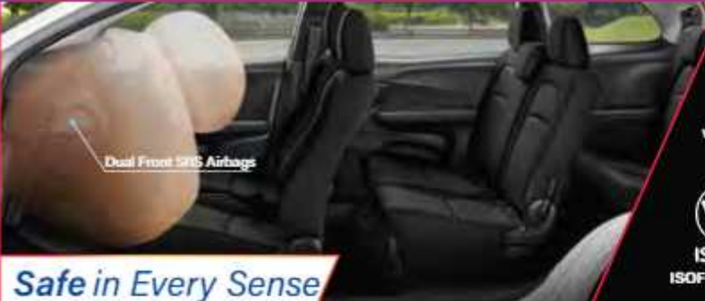
Dual Front SRS Airbags